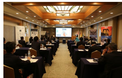
Business forum on trade and investment opportunities in Brunei Darussalam ブルネイにおける貿易投資の機会に関する ビジネスフォーラム

本事業は、日本の投資家がASEANのこれらの新しい成長分野に新たな投資を行うことをサポートします。それぞれの分野にかかる投資制度を紹介し、議論し、投資を促進するよう、各ASEAN加盟国への二国間交流の機会を提供します。