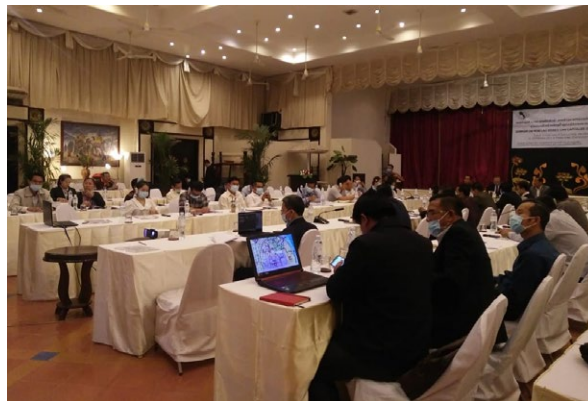
Hybrid Seminar for Lao MSMEs in Lao PDR ラオスの中小零細企業向けに実施されたハイブリッドセミナー

本事業は、前年度から引き続き、ラオスおよびカンボジアと緊密に連携し、各国独自のビジネス連携事業の発展を図ります。2021年度は、ベトナムとミャンマーを対象に産業連関と政策策定の可能性について調査を行う予定です。