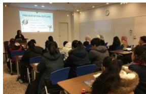
Hosting Group Visits グループ訪問の受け入れ