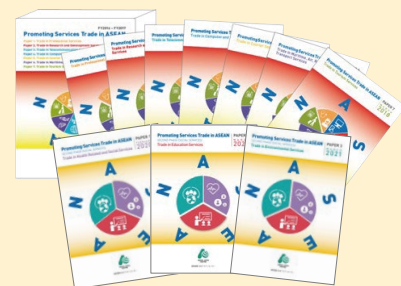
Promoting Services Trade in ASEAN paper series サービス貿易促進に関する報告書

2021年度は、ヘルスサービスにおける人の移動についての報告書の発行およびこれを議論するためのサービス貿易フォーラムの開催を予定しています。また、各分野の報告書をもとに、CCSなどの場で、サービス貿易を促進するための政策案について協議する予定です。