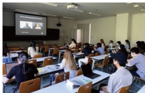
On-site / Online ASEAN Lecture 出張 / オンライン授業