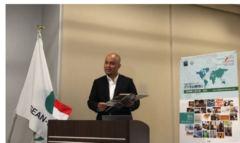
Indonesia Coffee Webinar organized in FY2020 (Mr. Arief Wibisono, Trade Attaché of the Embassy of the Republic of Indonesia) 2020年度実施「インドネシア・日本 オンライン・ビジネス・セミナー/ ビジネス・ミーティング」 (駐日インドネシア大使館 商務官 アリエフ ウィビソノ氏)

ASEAN諸国の中小零細企業（MSMEs）は新型コロナウイルス感染症の影響を強く受けています。MSMEsは、ASEAN加盟国の経済発展と成長に欠かせないものであるため、このプログラムでは各加盟国の優先分野、特にMSMEsに争点を当てたビジネスマッチングやウェビナーを通して二国間貿易の促進を支援します。