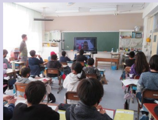
On-site/ Online ASEAN Class at an elementary school in Tokyo