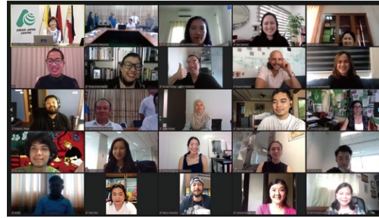
Online workshop on the Good Design Evaluation. グッドデザイン評価に関するオンライン・ワークショップ

本事業では、ASEAN加盟国 (特にブルネイ、カンボジア、ラオス、マレーシア、ミャンマー) が各国独自のグッドデザイン・プラットフォームを構築し、各国の零細中小企業がデザイン性の高い製品やサービスを生み出し、社会の持続可能な発展のために積極的に貢献できるよう、JDPと連携して支援を行っています。