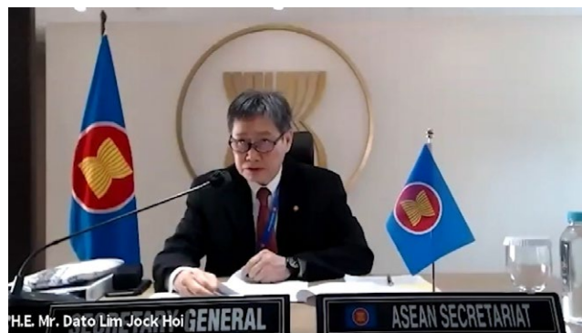
Keynote speech by H.E. Dato Lim Jock Hoi, Secretary-General of ASEAN at ASEAN's 53rd Anniversary Symposium ASEAN設立53周年記念オンライン・シンポジウムにおける ASEAN事務総長 リム・ジョクホイ氏による基調講演

また、本シンポジウムではASEANにおける貿易、投資、観光に関連した新たな課題について、日本の関係者の理解と協力を促し、ASEANと日本の更なるパートナーシップの強化を図ります。