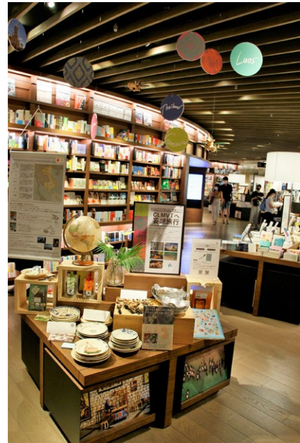
Mekong travel event at Umeda Tsutaya Books in Osaka 梅田蔦屋書店で実施したメコン旅行イベント

本事業は、観光業界および一般の観光者を対象に実施します。観光業界向けには、コロナ後を見すえ、特に若い女性をターゲットとしたCLMV旅行商品の開発に関するウェビナーを開催するほか、一般向けに、メコン地域の観光の魅力を広く紹介するプロモーションを行います。