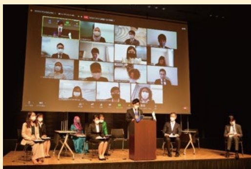
Future Leaders' Declaration on ASEAN-Japan Cooperation for International Marine Plastic Waste" launching ceremony in FY2020

2021年度は、2020年度本事業に参加した学生達の提案による「広島ASEANエコスクール(パイロットプログラム)」の実施を予定しています。広島県の小学生・高校生を対象に海洋プラスチックごみ問題に関する授業の実施や広島とASEAN諸国の学生が対話するフォーラムを開催する予定です。また、海洋プラスチック廃棄物に関するウェビナーや、ASEAN加盟国の代表者と海洋プラスチック廃棄物問題を解決するための製品やサービスを提供する日本企業との会合を実施します。